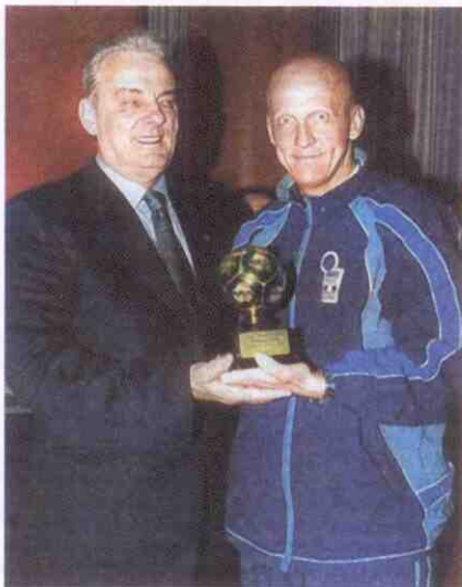
1999 год. Серджи Гонелла вручает приз Пьерлуидже Коллине – лучшему арбитру мира прошедшего сезона по версии IFFHS