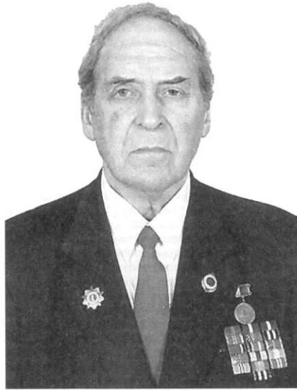
«АРБИТРЫ – ВЕТЕРАНЫ ВОЙНЫ»